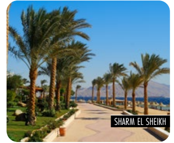
SHARM EL SHEIKH

Desayuno. A la hora prevista, traslado al aeropuerto de Sharm el Sheikh. Fin de los servicios. (Si lo desean, existe la posibilidad de ampliar las noches en Sharm El Sheikh. Consulten precios en el momento de solicitar la reserva).