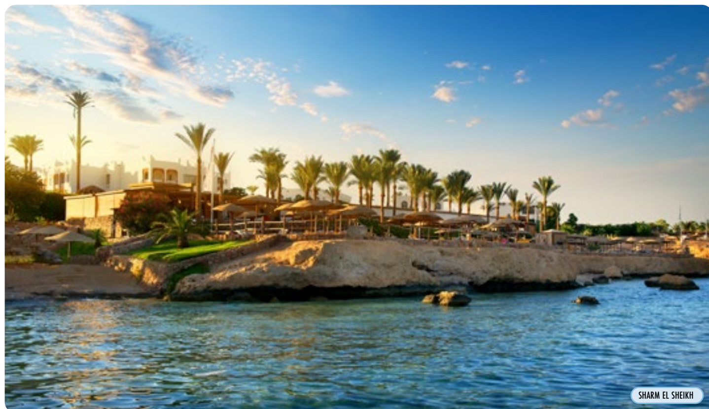
SHARM EL SHEIKH