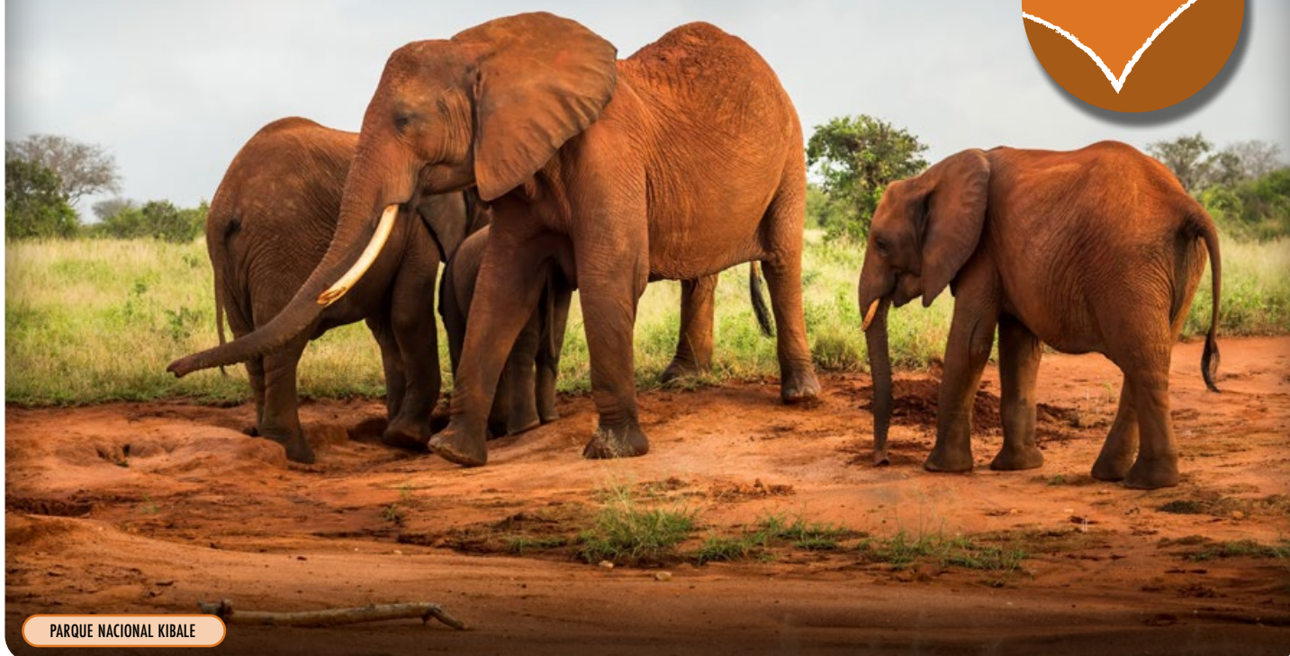
PARQUE NACIONAL KIBALE