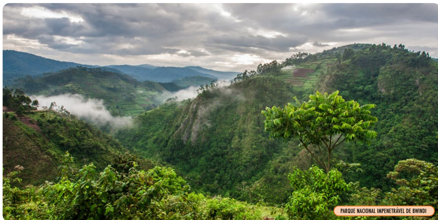
PARQUE NACIONAL IMPENETRÁVEL DE BWINDI